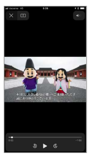
※音声ファイル、動画のナレーション・テロップも、ビーコンを受信した端末の設定言語に対応しています。