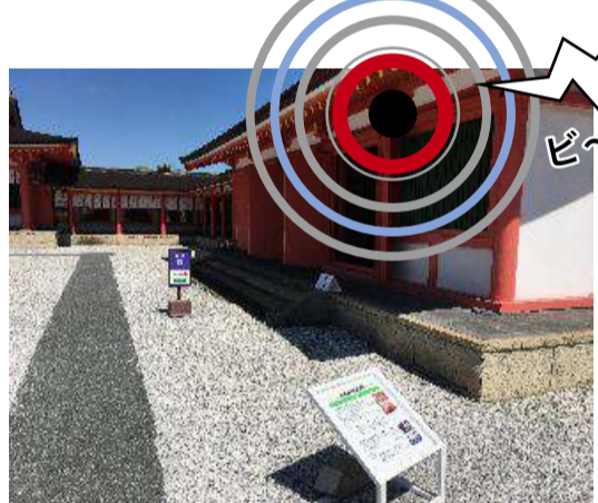
その施設に近づくと...